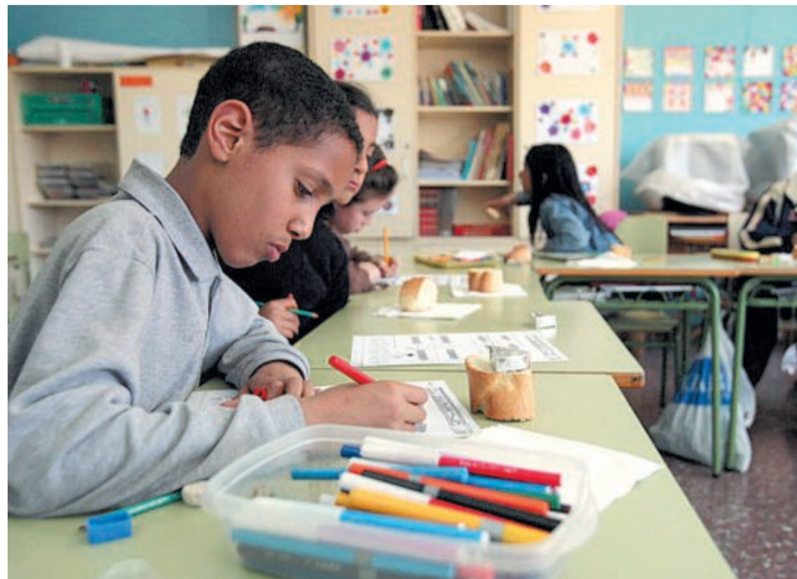
Alumnos inmigrantes del colegio Santo Domingo de Zaragoza.

Santiago Aldea explicó que la homologación sólo se refiere a tí-